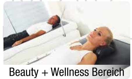
Beauty + Wellness Bereich

Entdecken Sie unseren neuen Premium-Fitnessclub mit vielen Neuigkeiten nach dem Umbau!