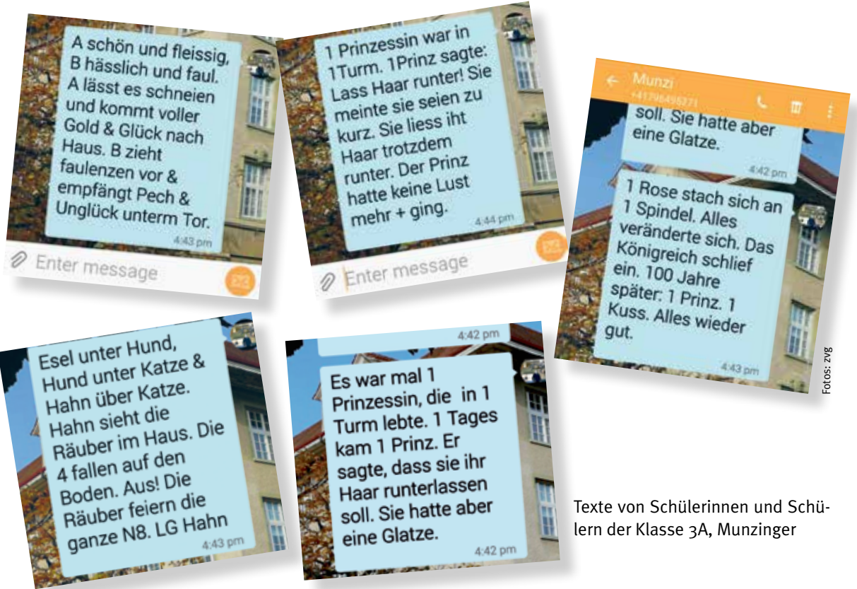
Texte von Schülerinnen und Schülern der Klasse 3A, Munzinger

Der Auftrag: Erzähle ein Märchen in der Länge einer SMS. Eine SMS ist maximal 160 Zeichen lang, Leerstellen zählen mit. Zahlen, Zeichen und Abkürzungen helfen dir, Platz zu sparen.