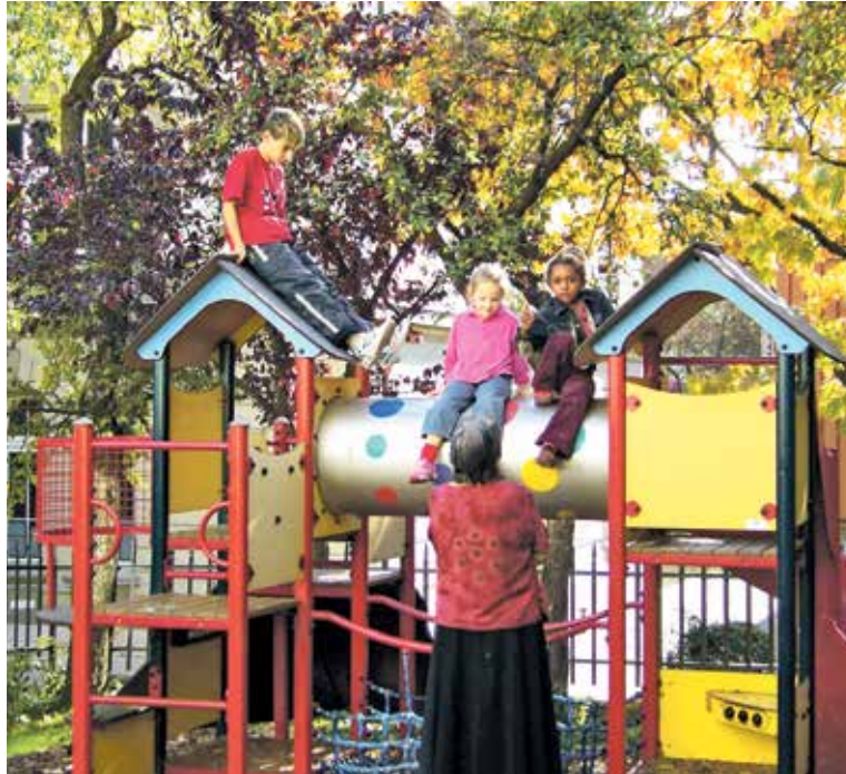
Entspannung im Garten des Ronald McDonald Hauses in Bern

In der Schweiz wurde die Ronald McDonald Kinderstiftung 1992 gegründet. 1994 eröffnete das erste Elternhaus in Genf. 2001 folgte ein