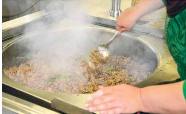
Mitarbeitende kochen für die Freiwilligen.

Freiwilligenabend: Mit einem Nachtessen und Unterhaltungsabend bedanken sich die Mitarbeitenden jedes Jahr bei den 350 freiwilligen Mitarbeitenden für ihr Engagement in der Pfarrei.