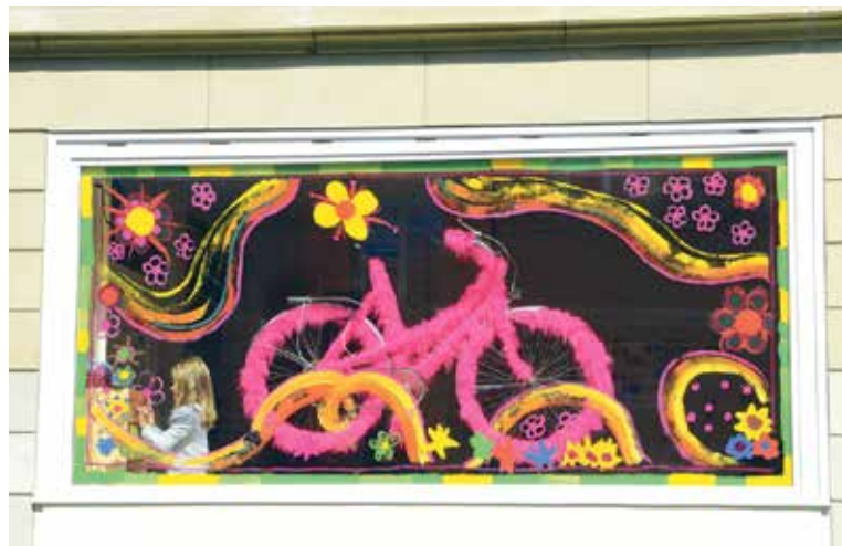
Velo-Schaufenster des Tagi Länggasse

Seit 2013 findet einmal im Jahr in einem Berner Quartier ein autofreier Sonntag statt. Der Anlass stösst auf Anklang: In den herausgeputzten Quartieren (2014 Breitenrain und 2015 Länggasse) tummelten sich jeweils rund 10'000 Besucherinnen und Besucher. Über 100 lokale Geschäfte, Ateliers und Restaurants präsentierten sich mit Workshops und einer Schaufensterausstellung von ihrer besten Seite. 2016 wandert die Idee nun in den