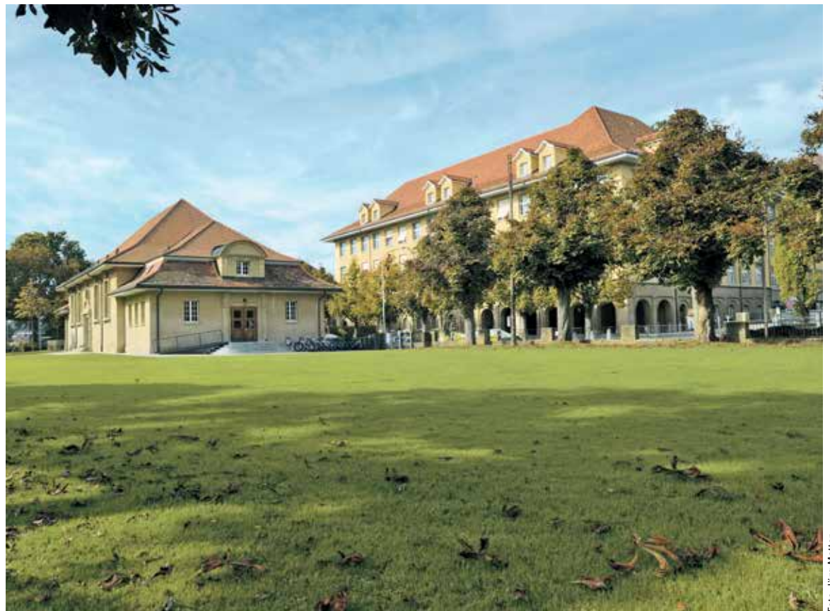
Mit der erzielten Lösung wird die ganze Wiese spätestens in 7 Jahren wieder als Aussenraum für das Quartier zur Verfügung stehen.