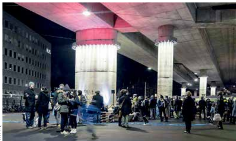
Eröffnungsanlass von Transform am 29. Januar auf dem Europaplatz mit Bar, Grill und Musik.