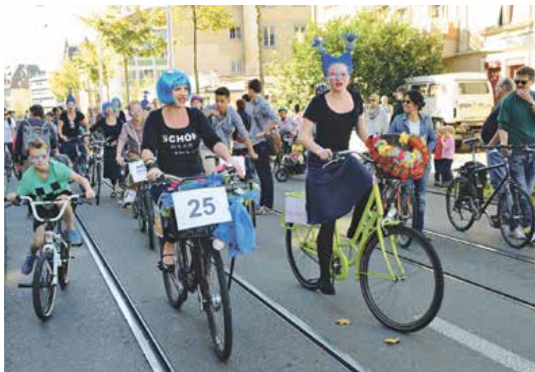
Velo-Fashion-Parade am autofreien Sonntag